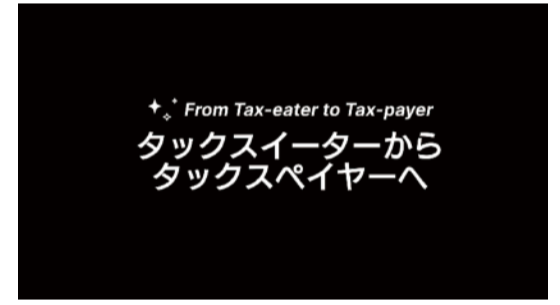
「タックスイーターからタックスペイヤーへ」 Sign with Me × team nagi