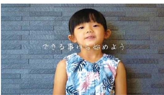
「できる事から始めよう」 ヨコ