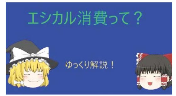
「【ゆっくり解説】今話題?のエシカル消費って?」 金お