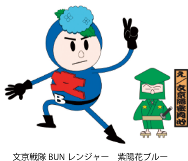
文京戦隊 BUN レンジャー 紫陽花ブルー