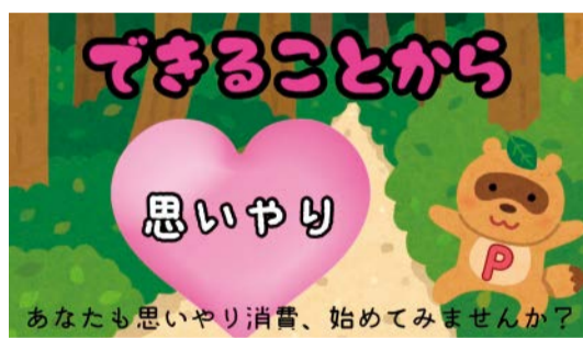
「できることから始めよう」 ちい